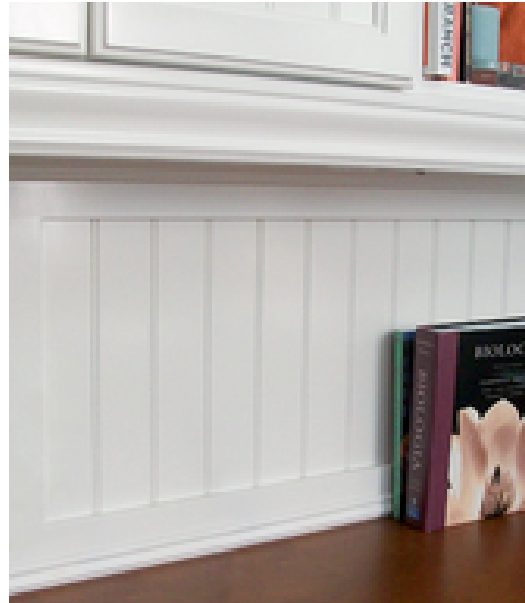
Arauco Tablero terciado Araucopy Revestimiento Natural