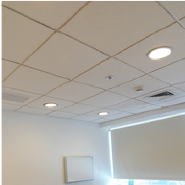
Etex Chile Cielo Acústico Registrable Decovinil - Romeral