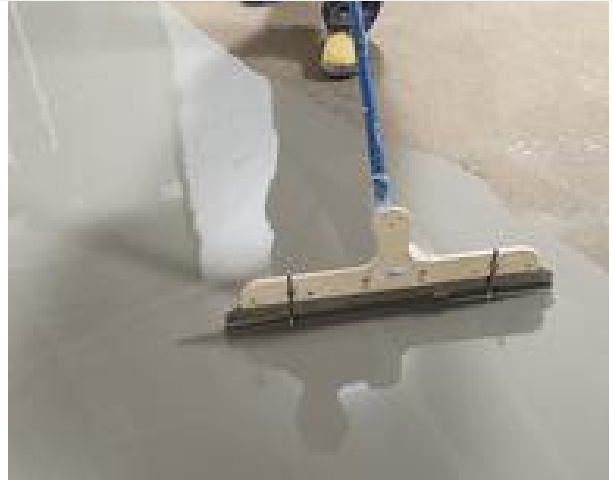
Aislantes Nacionales Niveladores de piso Bemezcla XL

Descripción enviada por el equipo del proyecto. El proyecto del TANATORIO DEL CARMEN en Torreagüera consistió en la reforma de un local incluido en una edificación ya existente de tipo industrial para la implantación de un programa de usos que incluye 3 salas de velación, una capilla, cafetería y espacios de uso interno del personal.